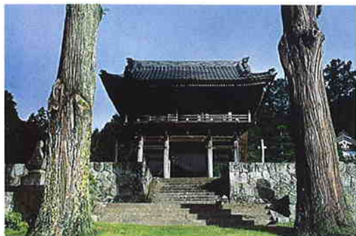
▲ 隣政寺山門 鎌倉時代より続く風格と威厳をただよわせている

日本の中心に位置し、雄大な南アルプスを正面に望む南信州・高森。谷川のせせらぎ、小鳥のさえずり、石仏のほほえむ緑深い森の中で、悠久の安らぎを。そんな思いをプランにしたのが「森に眠る納骨堂」です。