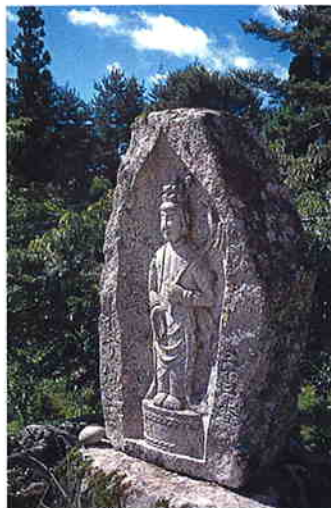
参道には20数体の石仏がほほえんでいます。

中央高速道路・松川I.C.より車で約10分 JR東海・飯田線「市田駅」よりタクシーで約15分