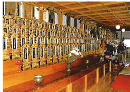
▲ 命日には位牌堂にて供養が行われます。